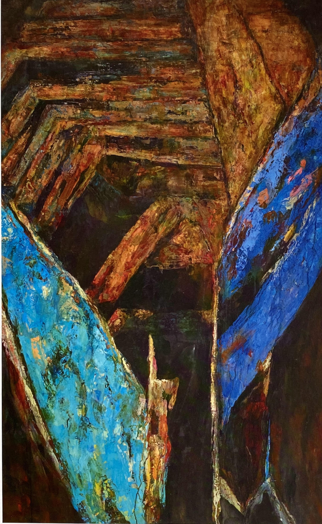
LA QUINTA ESENCIA. Oli sobre llenç de lli 162x145 cm. 2009

Pia Almoina de BARCELONA, a l'Europa Museum Schengen al GRAND DUCHÉ DE LUXEMBOURG, a NEW YORK al CSV "The incubator of art in New York", al Instituto Cervantes de CHICAGO i al Museo de Bellas Artes a la sala del parc García Sanabria de TENERIFE. Després d'aquesta mostra, centrada en la humanitat, arriba aquest nou esclat de color amb una sèrie de llenços que són un homenatge a la vida i que representen un renéixer de l'alegria després d'una gran tristesa.