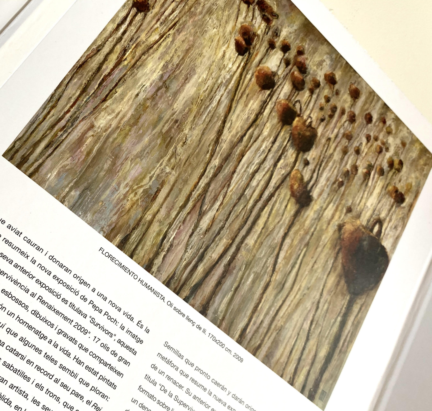
FLORECIMIENTO HUMANISTA. Oli sobre llenç de lli. 170x200 cm. 2009

...cuenta ...regentadas ...o. A mi entorga un ...escifrar el fondo, ...basa en este ...nstituyen ...ciones ...sta